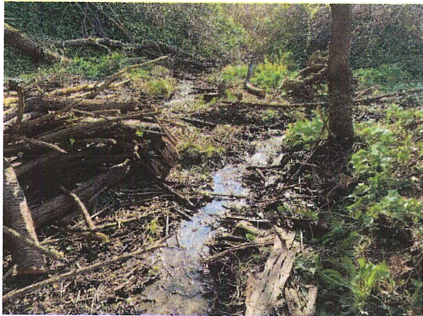
Egy vízmosás részlet tisztítás után: